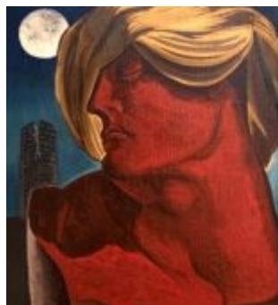
Also Known as Man Ray. Une collection particulière du 27 mai au 03 octobre 2021

Jusqu'au 26 septembre de 11h à 18h sauf le lundi. 5 rue Violette